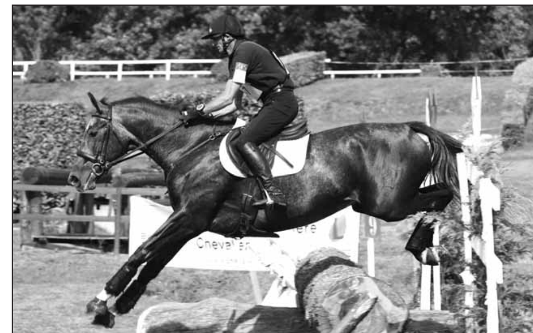
Nuage de Ribaud par Grain de Voltaire, champion des 4 ans

Alors que l'Equipe de France de concours complet, déjà Médaille d'Or olympique, nous revient des Championnats d'Europe de Blenheim toute auréolée d'une Médaille d'Argent, nous avons le plaisir d'accueillir ces jours-ci à nos Finales de Pompadour la plupart des cavaliers de haut niveau qui préparent ici leur relève.